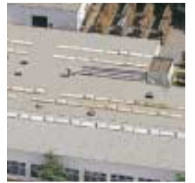
Zeven, Allemagne Siège du groupe