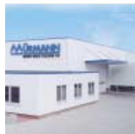
Wittenburg, Allemagne (LISEGA fabricant de produits filetés)